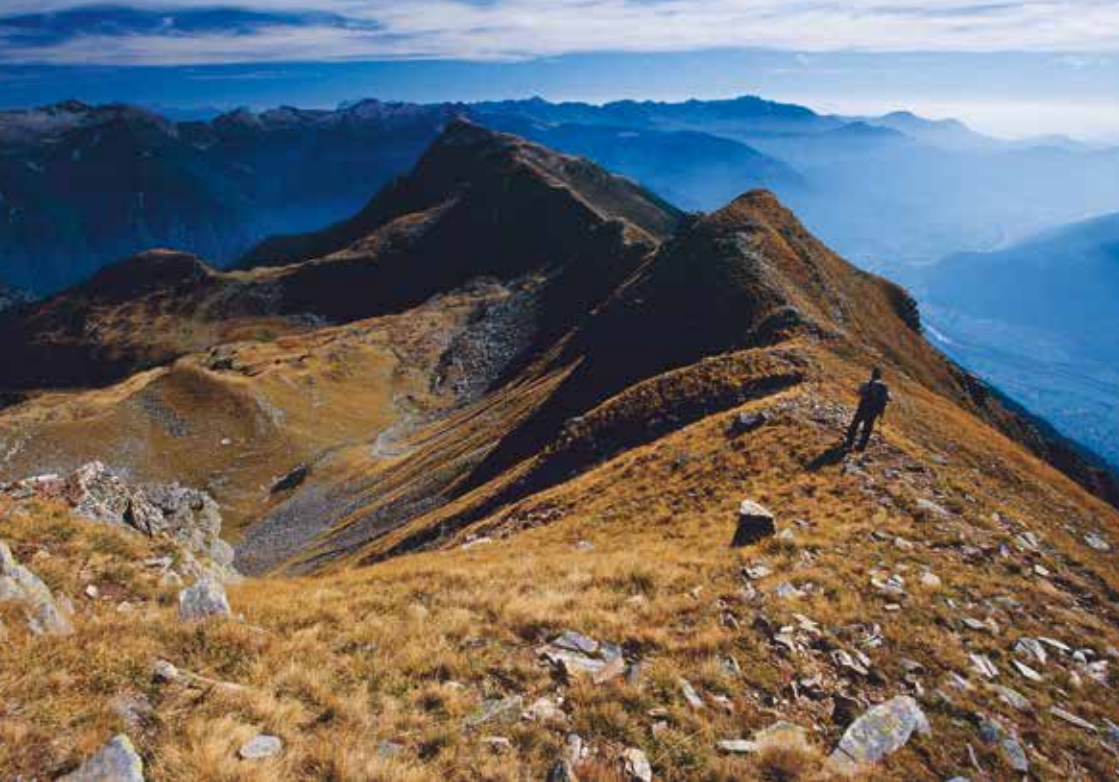
▲ Dal Pizzo di Claro sguardo sul bellinzonese