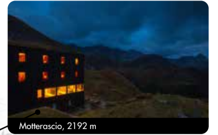
Motterascio, 2192 m