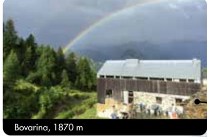
Bovarina, 1870 m