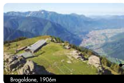
Brogoldone, 1906 m

Nota: Il percorso e i dettagli del bivacco riportati in questo prospetto possono ancora subire delle modifiche