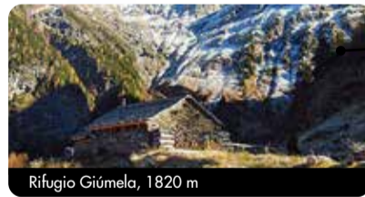
Rifugio Giümela, 1820 m