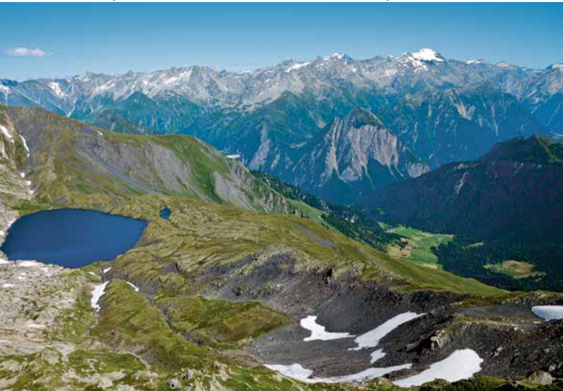
▼ Lago Retico