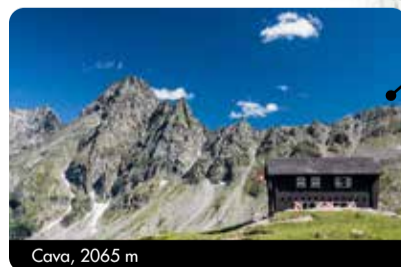
Cava, 2065 m