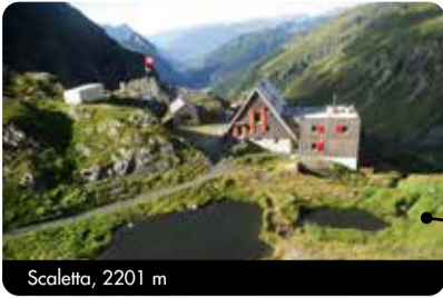
Scaletta, 2201 m