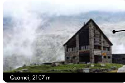
Quarnei, 2107 m