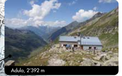
Adula, 2392 m