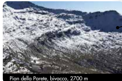
Pian della Parete, bivacco, 2700 m