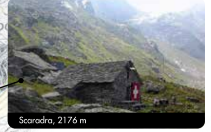
Scaradra, 2176 m